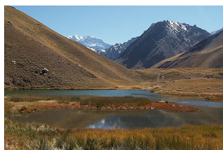
Aconcagua (v ozadju), najvišji vrh Amerik.