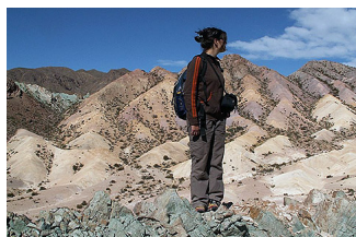
Barvitost dežele V od Uspallate.

Upam da nisva razočarala koga, ki mu je bil film všeč - ampak sprijaznite se, to je le Hollywoodska iluzija (priporočam ogled filma Mulholland Drive Davida Lyncha ).